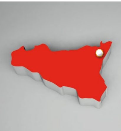
MESSINA Cattedrale (Duomo)