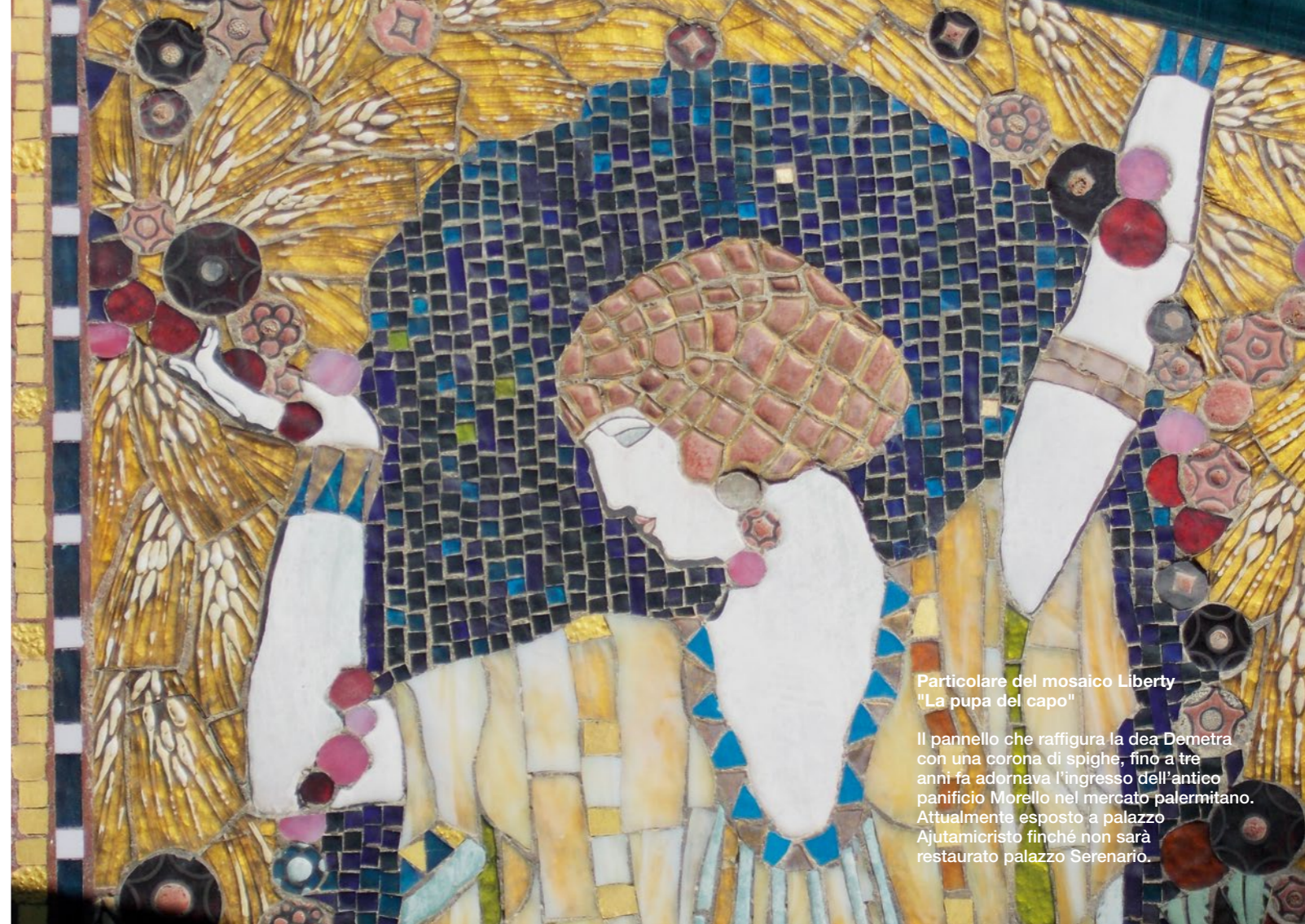
Particolare del mosaico Liberty "La pupa del capo"

Ordine dei Medici Chirurghi ed Odontoiatri della Provincia di Palermo